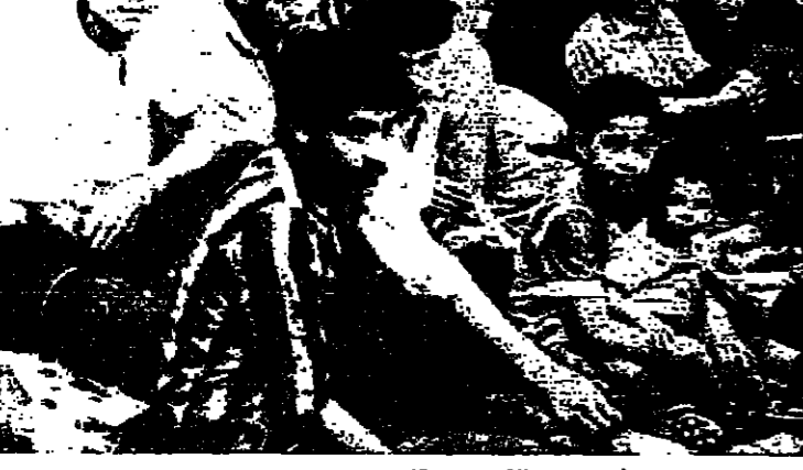
مباريون من الصنف والمقابل